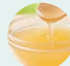
生ローヤルゼリー