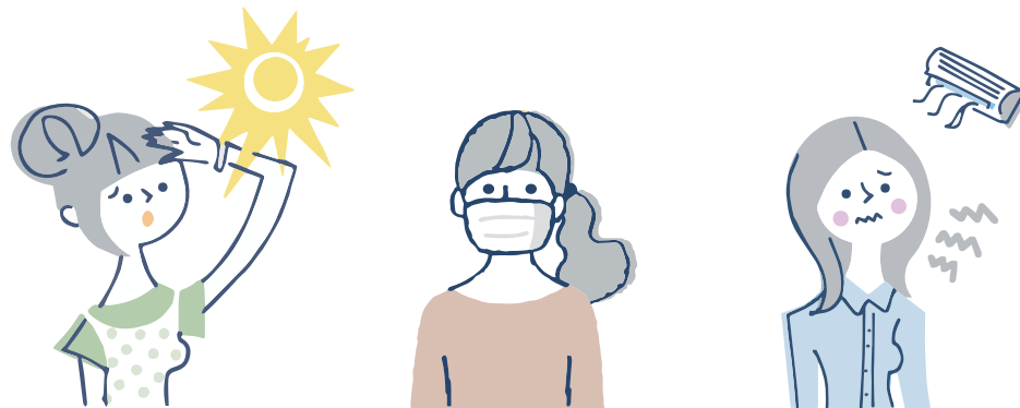
紫外線や汗による刺激