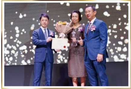
『OM-X』の販売に大きな貢献をされた方々を表彰しています。医師や博士、栄養士など多くの専門家が『OM-X』を推薦してくださっています。