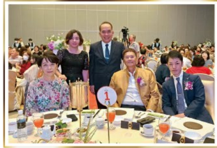
マレーシアでは30年以上の間『OM-X』が継続して販売されています。皆様それぞれに『OM-X』の体験や思い出があり、私も勇気づけられました。